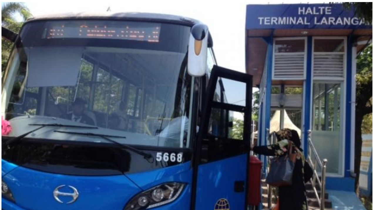
Figure 2. Aktivitas konsumen pengguna Bus Trans Sidoarjo

Seperti yang diketahui pada saat ini bus jenis (BRT) Bus Rapid Transit ini setiap harinya mengalami banyak kerugian, dari semula ada 30 unit armada yang dioperasikan di Sidoarjo kini berkurang menjadi 10 unit armada. Dan terakhir informasinya kini pada tahun 2019 tersisa tinggal 10 unit armada saja yang masih aktif dioperasikan. Sehingga internal masa tunggu keberangkatan Bus Trans Sidoarjo menjadi lebih lama daripada sebelumnya. Banyak penumpang yang mengeluhkan lamanya masa tunggu keberangkatan Bus Trans Sidoarjo. Dalam sekali jalan ngetemnya bisa sampai setengah jam. Tiga tahun dioperasikan, keberadaan Bus Trans Sidoarjo yang nyaman dan ber-AC ini tidak mampu menarik hasrat dan keinginan masyarakat [12].