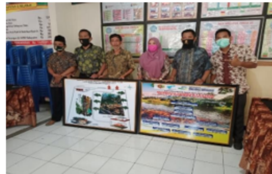
Figure 4. Kerja sama BUMDES Sumber Lestari bersama UNITOMO