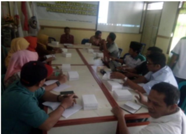
Figure 5. Proses evaluasi yang dilakukan oleh pengelola Sumber Dhuwur