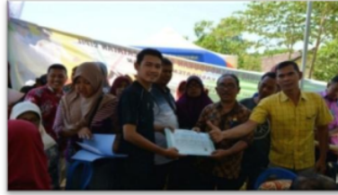
Gambar 3.1 Hasil atau keluaran dalam pelayanan langsung jadi