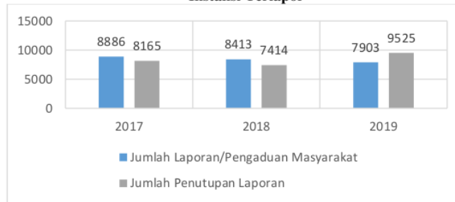
Gambar 1.1 Instansi Terlapor