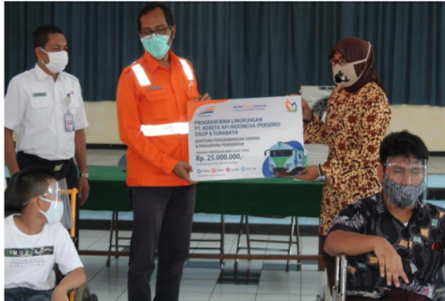
Gambar 2. Penerapan Program CSR PT. KAI Daop 8 Surabaya

bantuan dana yang diberikan dan bantuan tersebut di belanjakan dalam bentuk alat-alat podcast, meskipun demikian tetap ada kendala yang dihadapi dari internal yayasan itu sendiri seperti halnya anak-anak yang belum mampu mempraktekkan apa yang di ajarkan dengan benar karena pelatihannya dilakukan bukan pada guru yang ahli pada pelatihan untuk anak-anak cacat melainkan dilakukan oleh guru pihak dari pihak yayasan tersebut dan juga terkendala oleh sistem motorik anak-anak tersebut dan juga ada kendala ketika ingin mengajukan bantuan dana terhadap PT. KAI namun harus menunggu sampai PT. KAI benar-benar membuka program bantuan tersebut. [7]