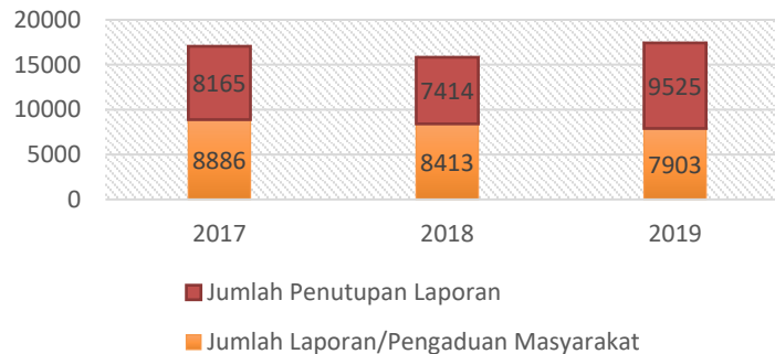
Gambar 1 1 Penyelesaian Laporan/Pengaduan Masyarakat tahun 2017-2019

Sumber : Data Penyelesaian/Laporan Masyarakat Tahun 2019 (Ombudsman RI)