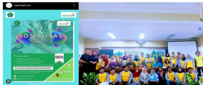
Gambar 3 Sosialisasi Pepelingasih di Media Instagram dan secara langsung

Dari hasil penelitian disebutkan bahwa penyampaian informasi kepada sasaran sudah tepat dan berjalan dengan baik. Pihak Dinas Pemuda Olahraga Kebudayaan dan Pariwisata Kabupaten Sidoarjo dalam menyampaikan informasi terkait dengan sosialisasi penjangingan pemuda ikut serta dalam program Pepelingasih telah mempromosikan melalui instagram, Sosialisai ke pihak Kecamatan dan Kabupaten, dan melalui pesan broadcast di grup kepemudaan dan komunitas Sidoarjo. Dalam sosialisasi penjangingan, setiap tahun Pepelingasih mengadakan agenda sosialisasi yang di isi dengan muatan-muatan keilmuan lingkungan hidup serta diskusi terbuka terkait peaksanaan pemilihan duta pada tiap tahunnya yang dihadiri oleh narasumber berkualitas.