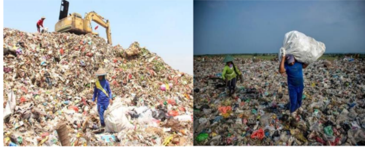
Gambar 1 Kondisi Sampah di TPA Jabon Kabupaten Sidoarjo Pada Tahun 2018

Badan Pusat Statistik Republik Indonesia pada tahun 2019 menyebutkan bahwa jumlah sampah yang diimpor ke Provinsi Jawa Timur mengalami peningkatan. Maka dari itu, ini menjadi tantangan bagi pemerintah dalam mewujudkan lingkungan yang asri dan bersih. Berdasarkan fakta dan berita terkait sampah yang telah menjadi permasalahan bersama. Dari segi pemerintah nasional hingga pemerintah daerah tingkat satu dan dua berusaha keras membuat program- program untuk penanggulangan sampah. Melihat kondisi sampah berdasarkan pengamatan penulis dari media berita, kondisi sampah di Kabupaten Sidoarjo sebagai berikut :