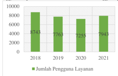
Gambar 1. Jumlah Pengguna Layanan Administrasi Kecamatan Tanggulangin Kabupaten Sidoarjo

Berdasarkan gambar 1. tersebut, dapat diketahui bahwa pengguna layanan pada kantor Kecamatan Tanggulangin dari tahun ke tahun mengalami penurunan dan peningkatan. Sehingga dapat dipahami bahwa penyelenggaraan pelayanan kepada masyarakat pada kantor Kecamatan Tanggulangin belum maksimal. Diharapkan pihak penyelenggara pelayanan publik dapat meningkatkan kualitas pelayanan agar kebutuhan masyarakat sebagai penerima pelayanan dapat terpenuhi dan memperoleh kepuasan.