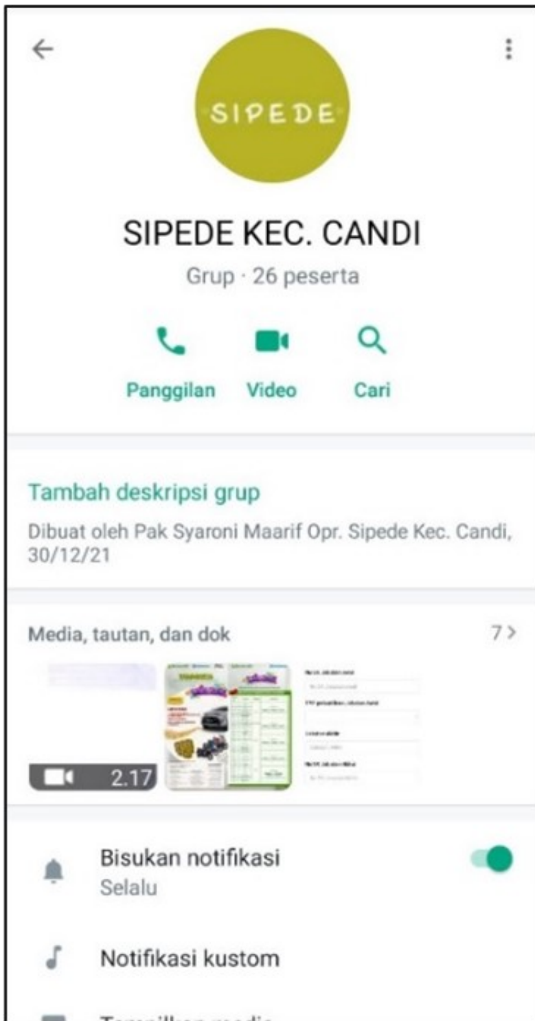
Figure 3. Tangkapan layar grup whatsapp pemantauan SIPEDE

Berdasarkan gambar tersebut dapat diketahui bahwa pemantauan dilakukan secara online melalui whatsapp grup. Gambar tersebut merupakan tampilan salah satu grup dari 18 grup pemantauan SIPEDE yakni Kecamatan Candi, tercantum pula grup pemantauan tersebut dibuat oleh Operator SIPEDE Kecamatan Candi. Pemantauan ini dilakukan 4 (empat) kali dalam satu tahun. Pemantauan dilakukan secara online yang dilakukan oleh Pengawas aplikasi web SIPEDE dan Operator SIPEDE Kecamatan yang mana setiap terdapat kendala atau keluhan aplikasi web SIPEDE error pada saat proses penggunaan SIPEDE tersebut dapat langsung melaporkannya ke whatsapp grup dan langsung direspon oleh operator SIPEDE kecamatan atau Pengawas aplikasi SIPEDE.