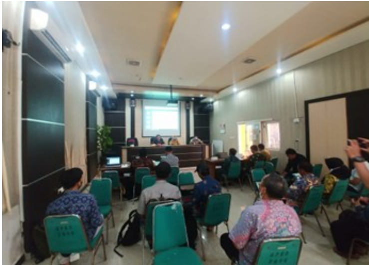
Figure 2. Dokumentasi sosialisasi web SIPEDE Dinas Pemberdayaan Masyarakat dan Desa Kabupaten Sidoarjo

Untuk mendukung pernyataan tersebut, berikut ini merupakan dokumentasi pada saat sosialisasi aplikasi web SIPEDE dari Dinas Pemberdayaan Masyarakat dan Desa Kabupaten Sidoarjo.