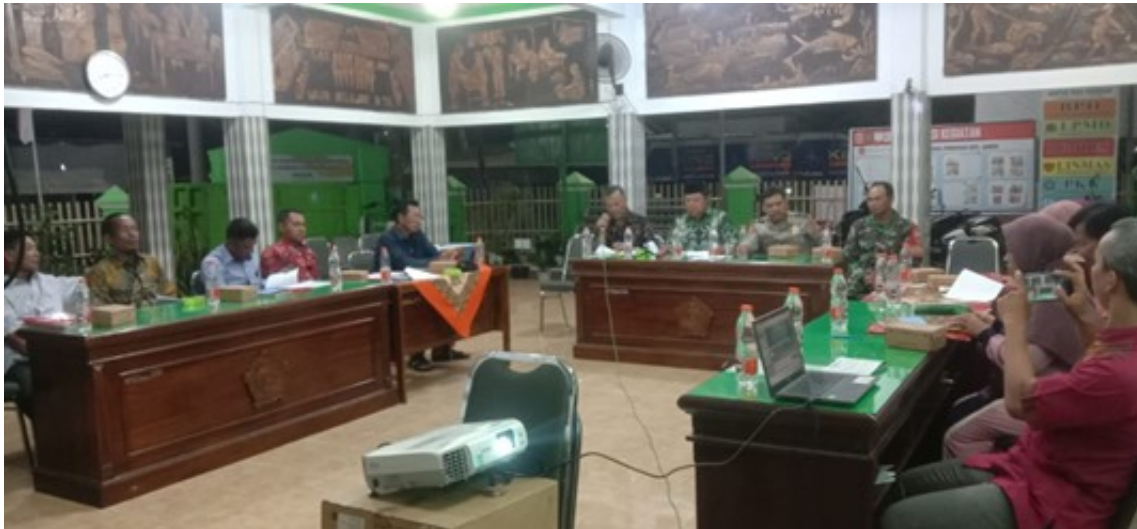
Figure 4. Kegiatan Sosialisasi Desa Pabean

Berdasarkan gambar 4 di atas dapat diketahui bahwa pemerintah Desa Pabean melakukan kegiatan sosialisasi yang melibatkan Kasun, RW serta Ibu PKK dan Kader Posyandu Desa Pabean guna memberikan informasi mengenai program kadarzi dalam percepatan penurunan stunting . Dengan harapan program tersebut dapat di sampaikan kepada warga sekitar sehingga masyarakat juga sadar akan pentingnya stunting tersebut dicegah. Namun, sosialisasi tersebut belum seluruhnya masyarakat mengetahui program tersebut.