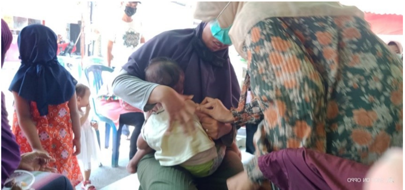
Figure 3. Kegiatan pemberian vaksin di Posyandi Desa Pabean

Pada gambar 3 dapat diketahui bahwa pemebrian vaksin terhadap balita di Posyandu Desa Pabean merupakan salah satu cara guna mencegah stunting pada balita di wilayah Desa Pabean Kecamatan Sedati Kabupaten Sidoarjo. Berdasarkan kesimpulan secara keseluruhan dengan indikator ketepatan sasaran tersebut bahwa Pemerintah Desa Pabean Kecamatan Sedati kabupaten Sidoarjo dapat dikatakan telah tepat sasaran. Karena Pemerintah Desa Melalui posyandu tersebut telah melaksanakan Program Keluarga Sadar Gizi (Kadarzi) dengan melakukan pemberian vitamin A, obat cacung, pendataan bayi-bayi yang mendapatkan asi eksklusif selama 6 bulan, pemberian